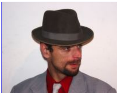
Autor artykułu Grzegorz Jerzy Skrabek

Było to kilkanaście lat temu. Wraz ze swoim kolegą wybraliśmy się na basen, było gorąco a kąpielisko było tak, blisko, że grzechem było przesiedzieć ten czas w domu. Poza tym były przecież wakacje. Tak, więc wzięliśmy koc, herbatę w słoiku, kanapki z żółtym serem ( w tamtych czasach wędlina to był rarytas) i krem "Nivea" do opalania. Jeszcze skok przez płot (bilety były bardzo drogie) i już byliśmy na plaży. Nie przeszkadzało nam to, że zamiast po piachu stąpaliśmy po trawie obrośniętej „ostem”. Co gorszy niezdara musiał potem uporać się z żądłem przypadkowo nadepniętej osy lub pszczoły.